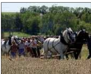
La Rétromoisson, un grand moment.

AUTREFOIS POURVOYEUR DE CHARBON DE BOIS POUR LES ACTIVITÉS MÉTALLURGIQUES LOCALES (XVIII e siècle et début de XIX e ), le patrimoine forestier entourant Saint-Loup s'est peu à peu amenuisé. Un temps bois de chauffage pour une par-