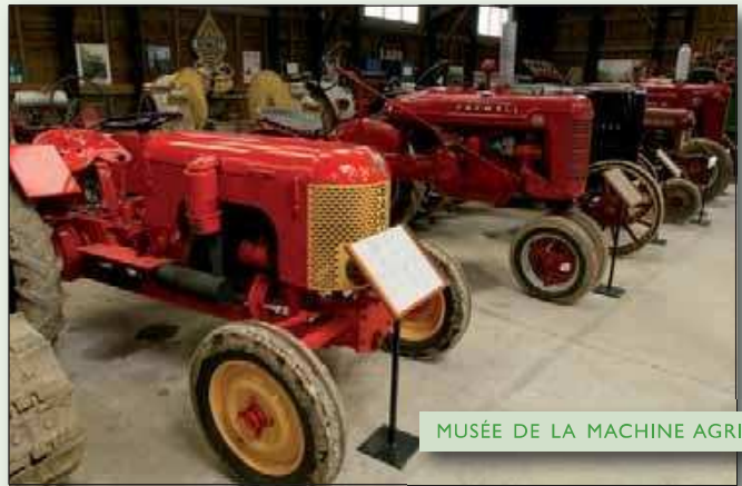
MUSÉE DE LA MACHINE AGRICOLE