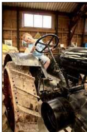
Le musée de la machine agricole fait le bonheur de tous, grands ... et petits.

puis, récemment, nous a v o n s donné des noms à nos rues et des numéros à chaque habitation." De la route de la Détorbe à celle du Maître de forge, en passant par le chemin du Petit Regain, ou en empruntant les sentiers de randonnée balisés, il fait bon flâner du côté de