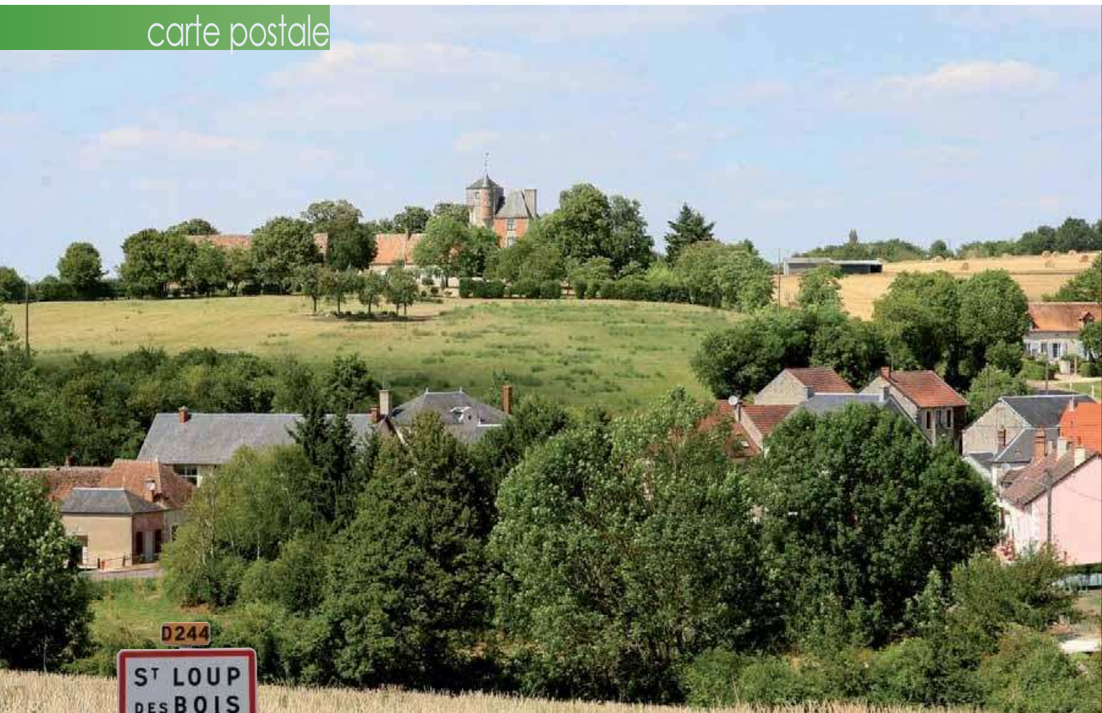
Entre cultures et prairies, Saint-Loup des Bois et ses trente et un hameaux s'étendent sur un territoire vallonné.